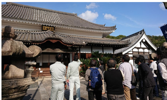
RI年度 現地講義の風景(国前寺)

※全課程修了者には、修了証を発行しヘリテージマネージャー(歴史的建造物保存活用資格者)として公益社団法人広島県建築士会に登録します(R6年4月1日現在230名登録)