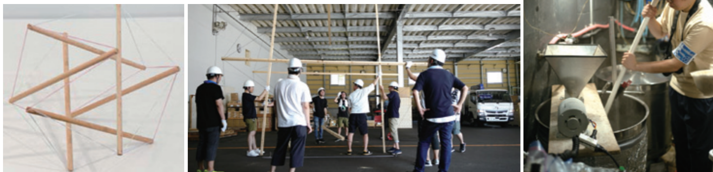
今回のテンセグリティ構造模型

青年部では毎年活動の一環で、広島市で行われる国際交流フェスティバル「ぺあせろべ」にイベントブースを出展しています。今年は10/6（日）に護国神社前で開催予定。「テンセグリティ構造ワークショップ」と「建築士ビール」の2つを準備中です。不思議な構造物を眺めながら、建築士印のビールを味わってみませんか？