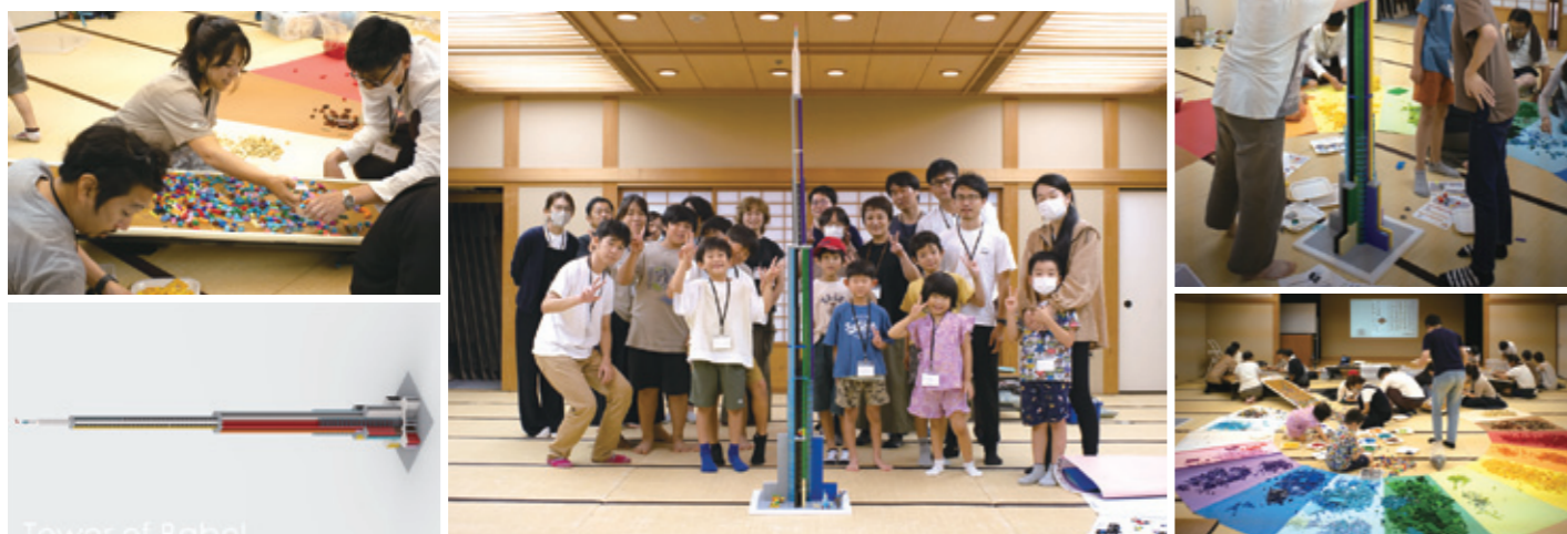
下：オリジナルの設計図を用意

8/10 身近なレゴを使って、親子で建築やまちづくりを体験できるワークショップを昨年に続き今年も開催。連休初日にもかかわらず、中区アステールプラザに約30人が集まりました。3回目の今回は「バベルの塔」を模した空想建築に挑戦！会場は畳の大広間に大判の色画用紙を環状に広げ、パーツを色別に仕分けながら作れるようにしました。最終的に3時間で2mを超える構造物が完成！ご参加頂いた皆様ありがとうございました。（製作したバベルの塔はその場で解体しました。）